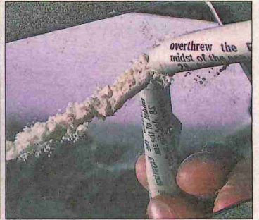
Les anàlisis de les aigües residuals de Lleida revelen elevats nivells de consum de la majoria dels tipus d'estupefaents.