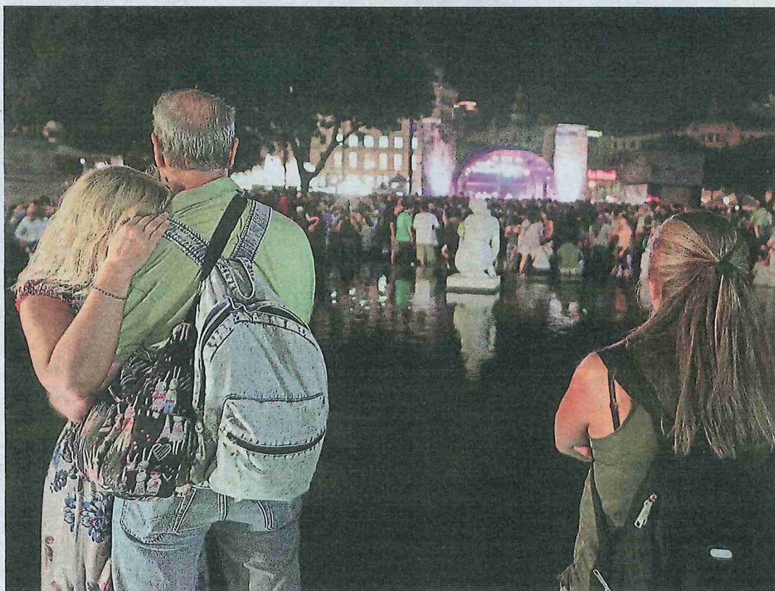
Una parella madura s'abraça durant les festes de la Mercè a Barcelona

Quan es tracta de salut sexual, aquest col·lectiu surt poc a les enquestes. Sovint es pregunta a la població de fins a 55 anys, o puntualment una mica més, sense tenir en compte que l'activitat sexual pot arribar molt més enllà. Un estudi suec apuntava que el 46% de les persones de 60 anys o més són sexualment actives. I un altre assegurava que en el cas dels més