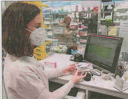
Venda de tests d'antígens ahir en una farmàcia de Lleida.

Així mateix, va fer una crida a la necessitat de "continuar prioritant la vacunació dels menors de dotze anys".