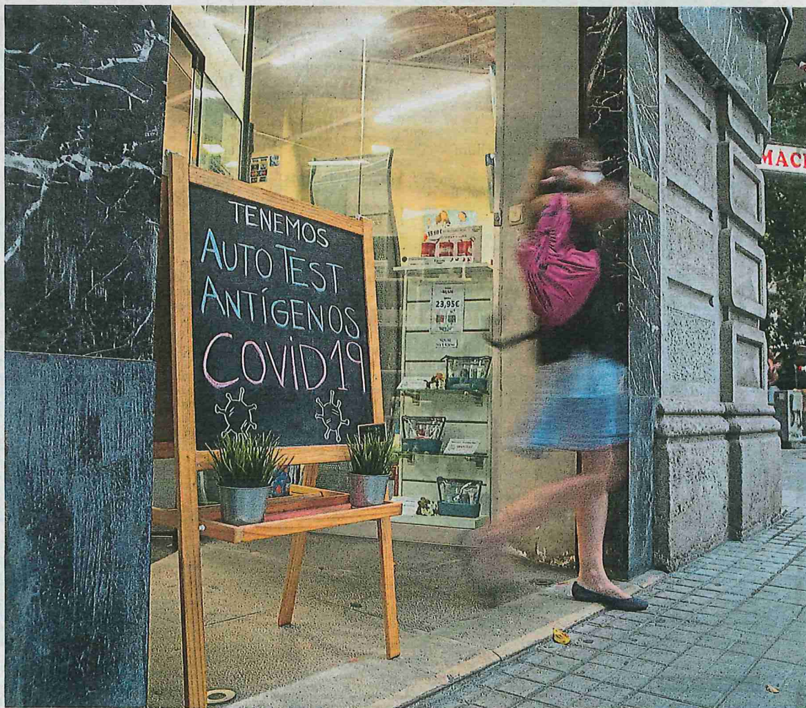
Les farmàcies venen tests que es pot fer l'usuari però que no proporcionen el codi QR que es demana per entrar al lleure nocturn

■ Potser és prematur perquè només funciona des de fa cinc dies, encara que s'anunciés abans, però el passi covid no ha animat gaire les xifres de vacunació, que van caure a l'agost i han anat cada setmana a la baixa. Segons les dades de Salut, de l'1 al 7 d'octubre, es van posar a Catalunya 19.398 primeres dosis i 30.806 segones, unes 21.000 menys que la setmana anterior i gairebé 40.000 menys que dues setmanes abans. És cert que dijous i divendres hi va haver un cert repunt respecte als dies previs, es van administrar més de 4.000 primeres dosis, prop de 5.000 divendres, fet que suposa fins i tot 400 més que una setmana abans, però menys que el 30 o el 24 de setembre, quan se'n van injectar més de 5.000. La cobertura vacunal de la població catalana d'entre 20 i 34 anys és d'un 65%, inferior a la de les altres edats. Divendres, el conseller Josep Maria Argimon va dir que l'objectiu del passi covid no era augmentar la vacunació com es va concebre a França, sinó donar una capa més de seguretat davant dels contagis pel virus al lleure nocturn.