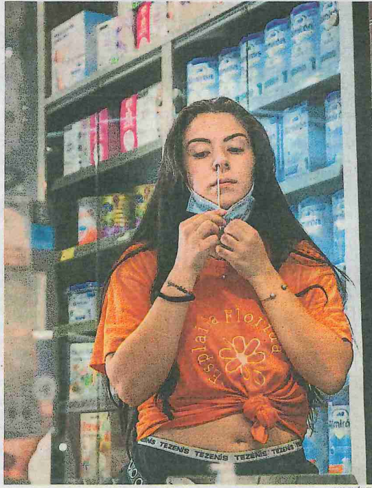
Una jove pren la mostra nasal per al test d'antigens