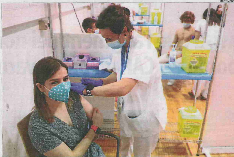
Una jove de 27 anys rep la vacuna de Pfizer ahir al pavelló Onze de Setembre.

Amb tot, Argimon va explicar que “el Regne Unit ens porta vint dies d'avanatge en l'augment de contagis i no hi ha hagut ni més ingressos ni més morts, per la qual cosa confiem que aquí també es compleixi”.