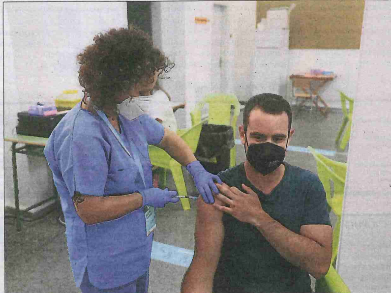
Imatge d'un lleidatà de 30 a 34 anys (n'hi ha gairebé 25.000) que ahir es va vacunar a Alcarràs.

A Lleida, el 73 per cent dels 117 positius detectats aquesta última setmana són menors de 40 anys, i encara que no hi hagi casos greus entre ells, sí que preocupa la població de 60 a 69 anys que encara no ha rebut la segona dosi d'AstraZeneca, ja que la primera no és prou eficaç contra la variant delta, la més