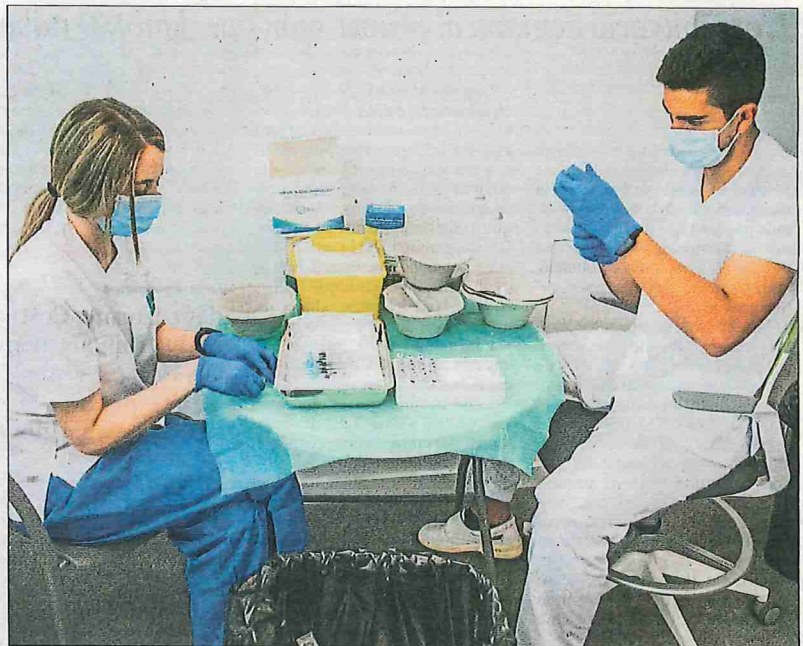
Dos sanitaris preparant les vacunes ahir al centre de vacunació de La Maquinista

També hi ha opinions molt fermes entre els candidats a rebre la dosi en contra de combinar vacunes que provoquen la immunitat per camins diferents (a través d'adeno-virus, a través d'ARN missatger). La falta d'experiència en detall va ser el motiu de l'assaig espanyol, però no ha estat cap obstacle a Dinamarca, Alemanya o França. N'han tingut prou de saber que al final utilitzen el mateix punt d'estimulació per generar la immunitat. ●