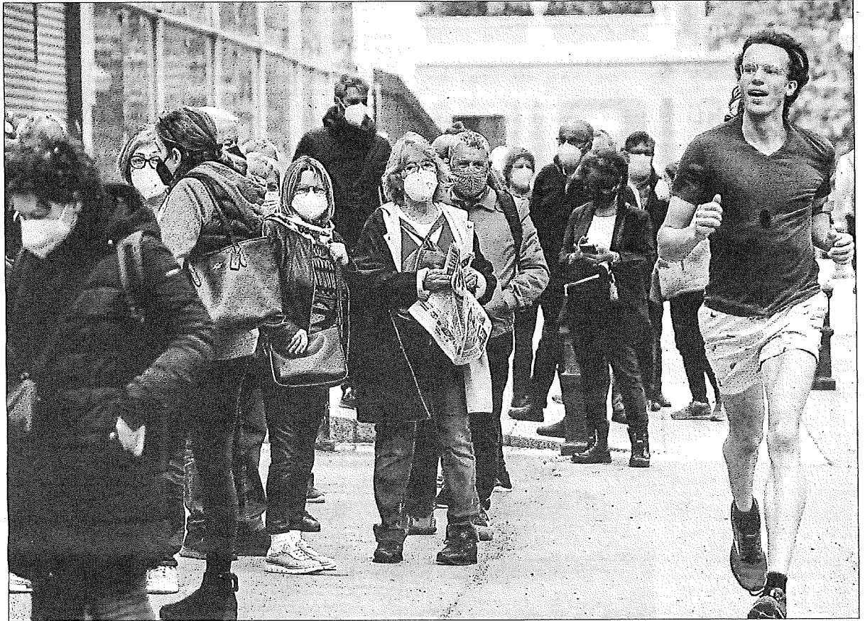
A la Fira Dos mil barcelonins d'entre 70 i 79 anys van ser convocats ahir per rebre la vacuna a l'espai preparat a la Fira de Montjuïc. L'operació es repetirà avui i demà en aquest indret, i també en altres grans recintes de Tarragona, Lleida i Girona

136 morts Un total de 136 persones van morir ahir de covid; a 1.107 els van donar l'alta