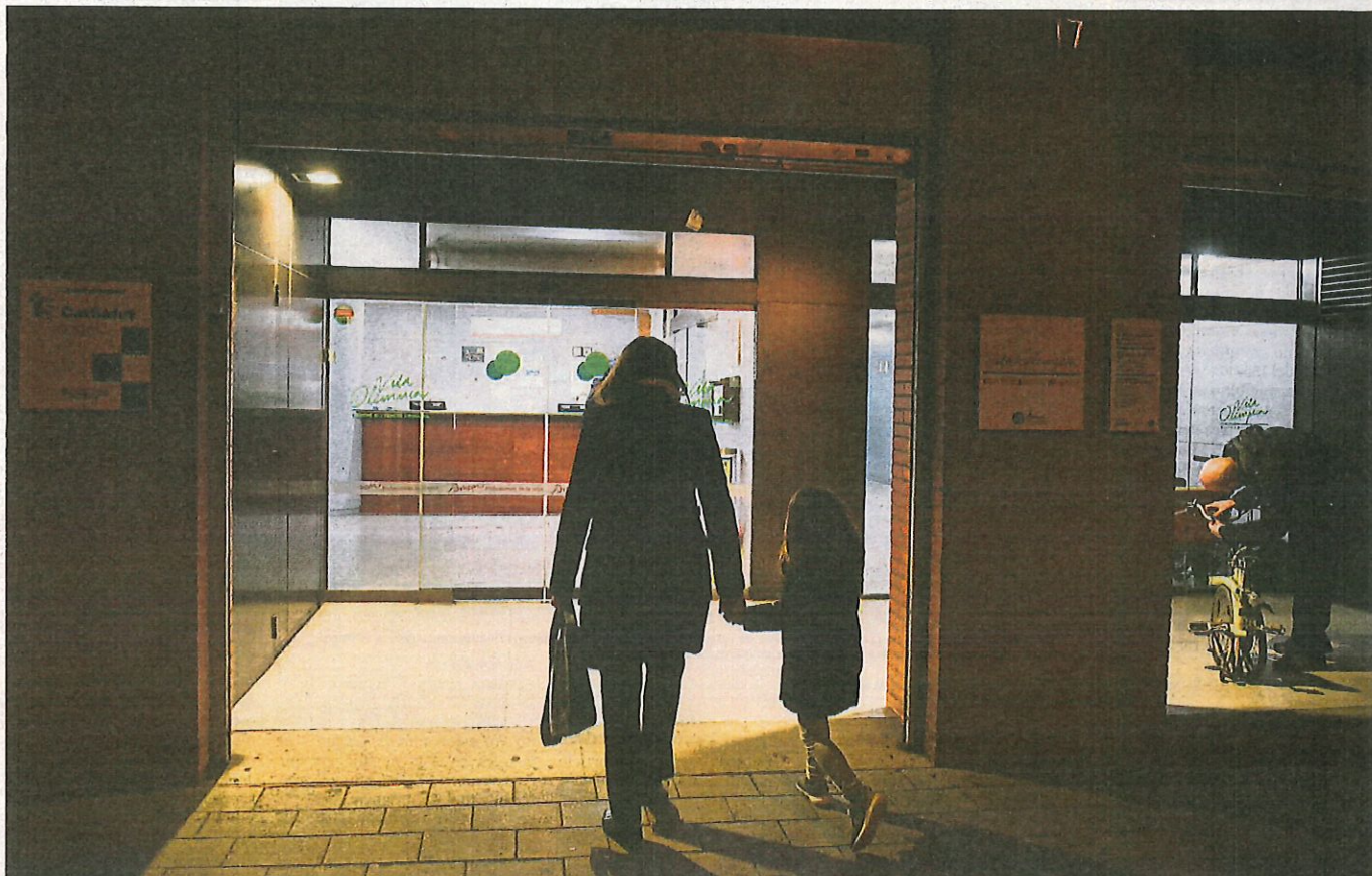
Imatge d'arxiu d'una mare acompanyant la seva filla al pediatre en un dels ambulatoris de la Vila Olímpica de Barcelona