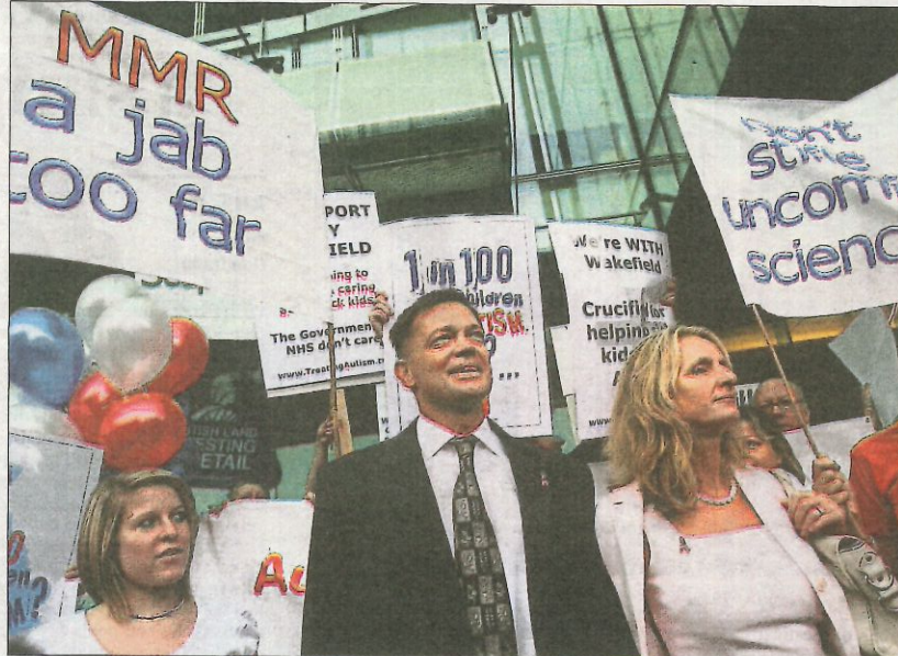
Amb ell va començar tot: l'exmetge Andrew Wakefield va falsejar dades sobre la seguretat de la vacuna

El nombre de morts va ascendir l'any passat a 110.000, cosa que reflecteix els progressos que s'han fet des de la introducció de la vacu-