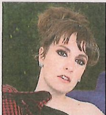
L'actriu Lena Dunham

■ L'actriu Lena Dunham, creadora de la sèrie nord-americana Girls , va anunciar el mes de febrer passat que s'havia sotmès a una extirpació d'úter per l'endometriosis que tenia, que li provocava dolors intensos i hipermenorrea (menstruació abundant), segons va explicar la mateixa afectada en un article a la revista Vogue . Dunham (31) va fer pública la malaltia fa uns quants anys. L'èxit de la sèrie Girls ja l'havia convertit en una celebritat atípica, i va voler aprofitar-ho per cridar l'atenció sobre l'endometriosis, una malaltia menystinguda malgrat que s'estima que la pateixen, en