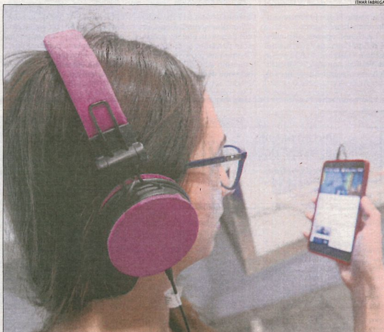
Els traumatismes acústics per excés de soroll són una de les causes dels acúfens entre els joves.