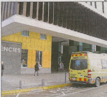
Vista de l'hospital Parc Taulí de Sabadell, on va ingressar.