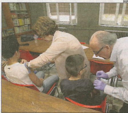
Imatge d'arxiu de vacunació d'un col·legi de Lleida.