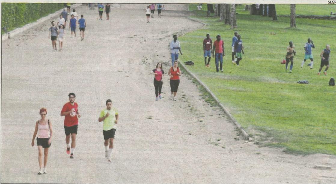
Imatge d'arxiu de lleidatans practicant el 'running' a la canalització del riu Segre.

de forma ocasional, i entre un 2,6 i un 4,6 per cent fa un consum "de risc" d'alcohol, amb més prevalença en homes que en dones.