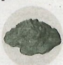
SUBSTÀNCIES QUÍMIQUES SOLUBLES