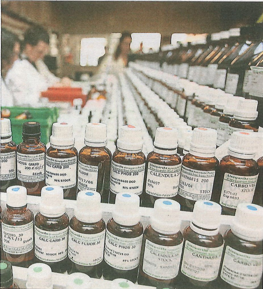
PETER MACDIARMID / GETTY

Enmig del conflicte, el doctor Alan Levinovitz, contrari a l'homeopatia, argumenta que l'etiquetatge pot provocar l'efecte contrari en aquesta època de teories conspiradores. Si alguna cosa es marca com a anticientífica pot esdevenir encara més atractiva. ●