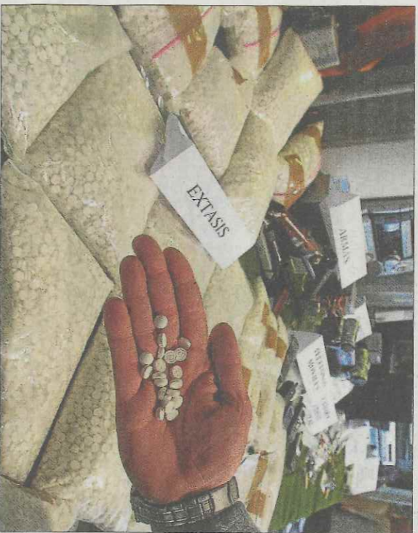
MARC ARINS / ARNU

Un altre problema a què s'enfronten els serveis sanitaris europeus és el de com donar resposta al "dinàmic i canviant" mercat de les noves drogues. Més del 60% d'aquestes substàncies són cannabinoides sintètics, que ocupen també un lloc destacat entre les 98 substàncies noves detectades per primera vegada el 2015. "No