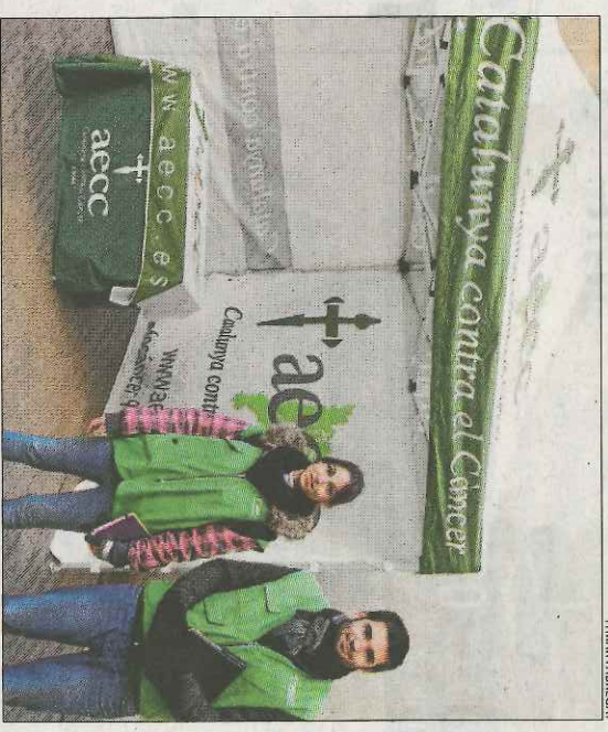
Dos voluntaris de l'AECC, ahir a la plaça Paeria.