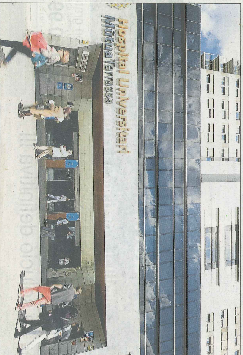
L'hospital Mútua de Terrassa és un dels grans centres concertats de la xarxa sanitària pública

"Estem amb l'aigua fins al coll". Així es van definir abir en un comunicat la Unió Catalana d'Hospitals i el Consorci de Salut i Social de Catalunya. Entre tots dos acullen la pràctica totalitat