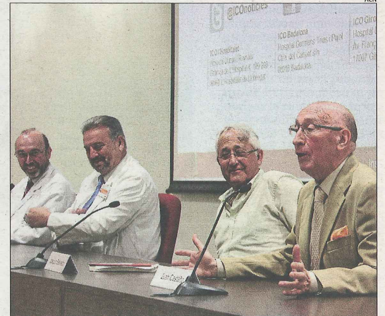
Dos dels pacients van explicar ahir la seua experiència.

Cada any es diagnostiquen a les comarques lleidatanes aproximadament 600 nous casos de càncer de pròstata.