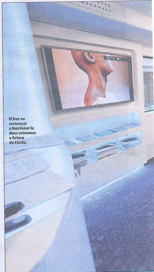
El bus va començar a funcionar fa dues setmanes a Artesa de Lleida.

Els resultats de les proves s'inclouran a l'historial mèdic de manera que el metge de família podrà determinar-ne l'abast i establir mesures.