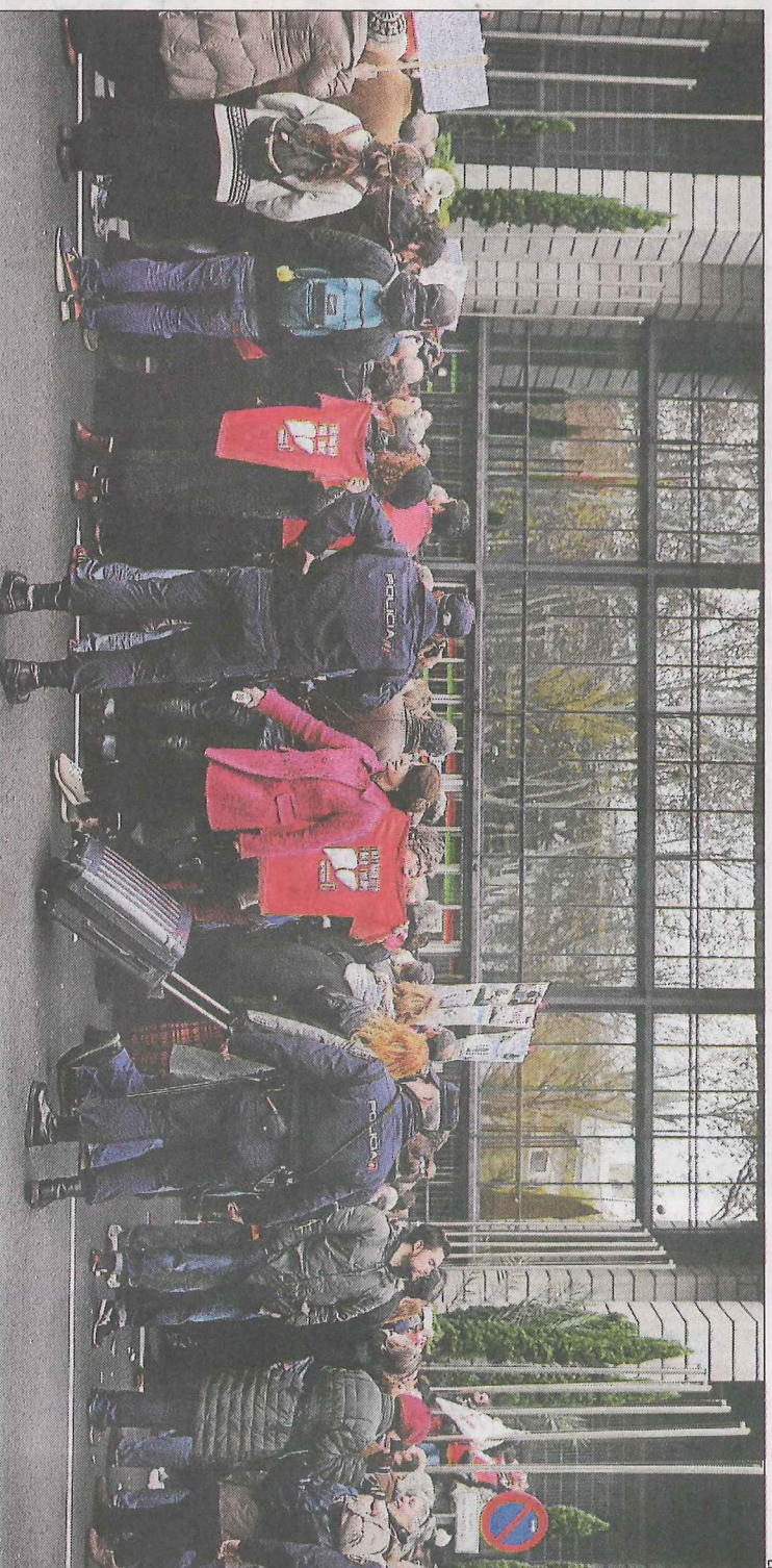
Imatge d'arxiu d'un concentració d'afectats per hepatitis C davant del ministeri de Sanitat fa unes setmanes.

Els medicaments antivírics poden curar la infecció, però l'accés al diagnòstic i tractament és molt limitat, segons l'OMS.