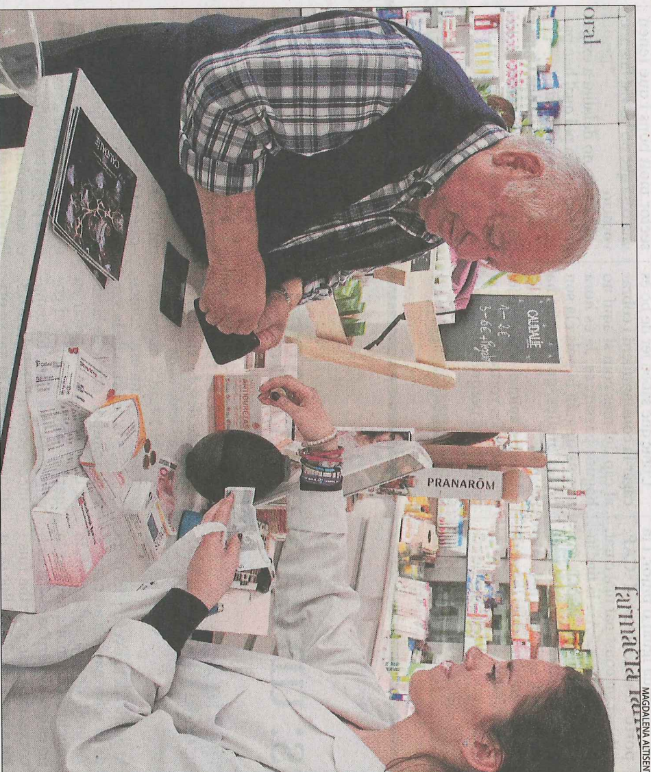
Una farmacèutica torna el canvi a un pacient que havia anat a proveir-se de medicaments.

El percentatge que paguen els pacients és un punt més alt al Pireneu que al pla, circumstància que amb tota probabilitat està relacionada amb el fet que les seues comarques tenen una població més envellida, per la qual cosa l'efecte del copagament dels pensionistes és més gran. El delegat de Salut, Josep Pi-