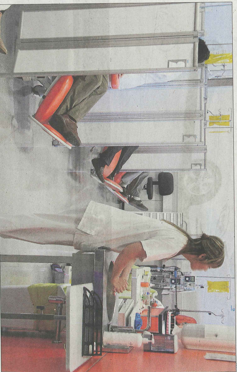
Les actuals sessions de quimioteràpia solen durar hores, mentre que l'administració del nou fàrmac es fa en minuts.

Segons va explicar el cap del Programa de Càncer de Mama de la Vall d'Hebron, Javier Cortés, "en vista dels resultats obtinguts, estem investigant ara el