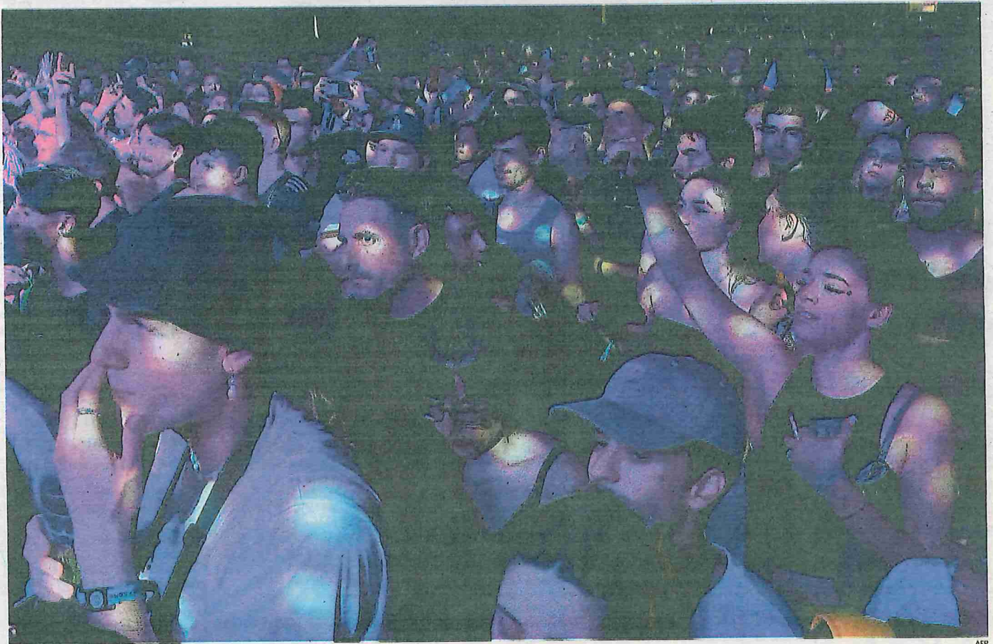
Un moment del concert de Morad de dissabte al Sónar, un festival molt esperat a Barcelona després de tres anys de silenci per la pandèmia