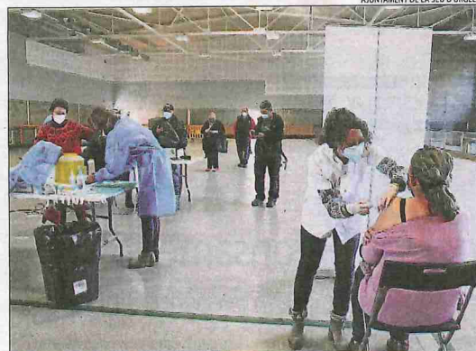
Vacunació ahir a la pista polivalent de la Seu d'Urgell.

servirien per a primeres. Vergés també va demanar al ministeri de Sanitat "celeritat" pel que fa a "la presa de decisions", com "autoritzar" la realització de tests d'antígens a les farmàcies i decidir què passarà amb les segones dosis d'AstraZeneca per als menors de 60 anys i que han d'administrar-se a partir del 26 d'abril. Aquesta qüestió es debatrà avui en el Consell Interterritorial.