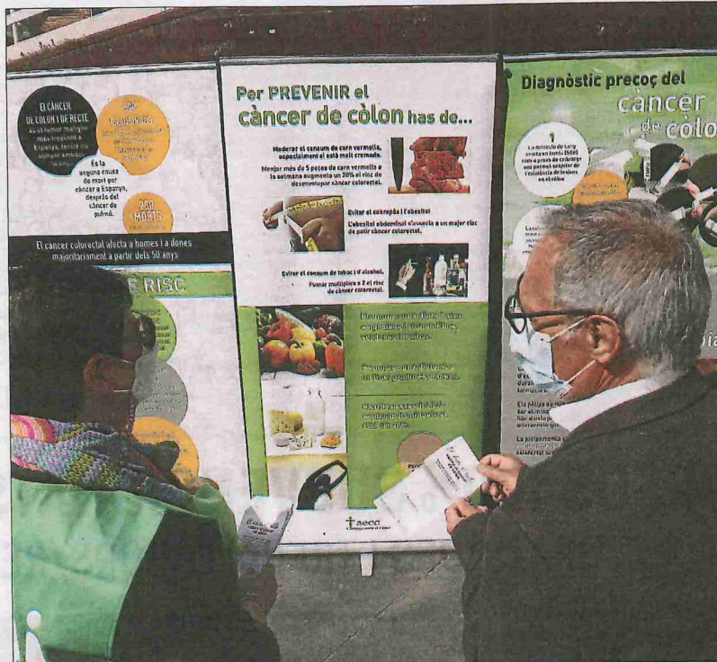
Exposició de l'AECC Lleida sobre la prevenció del càncer de còlon a la plaça Ricard Viñes.

En aquest mateix sentit, cal recordar que el càncer colorectal és el segon més freqüent en dones (14,39%), abans del de mama i seguit pel de pròstata i pulmó, i en homes (13,42%), darrere del de pròstata i davant del de pulmó.