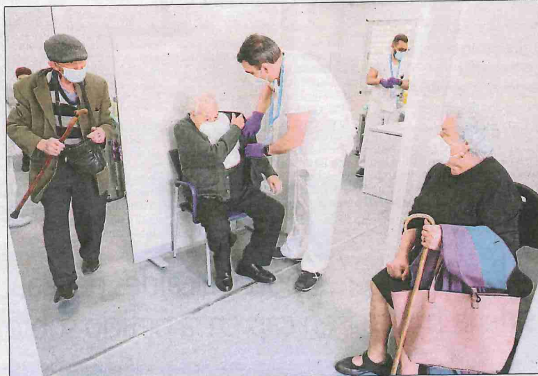
Imatge del mòdul del CAP de Balàfia, el primer de la ciutat en funcionament.