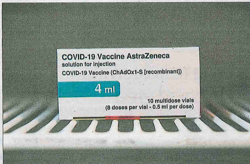
Una cinquena part de l'estudi clínic fet als EUA eren persones de més de 65 anys

L'anàlisi clínica avala una alta protecció global sense causar efectes secundaris