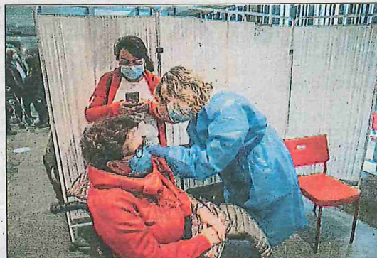
Vacunació ahir de gent més gran de 80 anys a Barcelona

La taxa de transmissió (l'PR) ha pujat els últims dies, a 1,01 ahir (cada infectat encomana el virus a una altra persona), però gairebé no varia des de fa un mes. I els tests d'antígens a simptomàtics, un indicador immediat, continuen com la setmana passada, afirma l'analista. Tot i això, si que és preo-