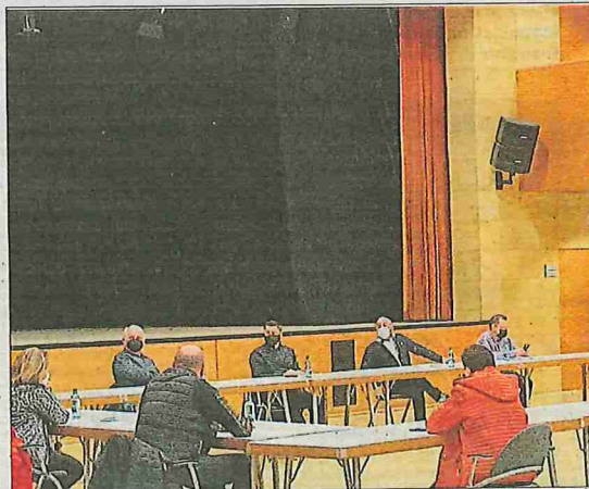
Reunió d'alcaldes del Segrià aquest dijous a Alcarràs