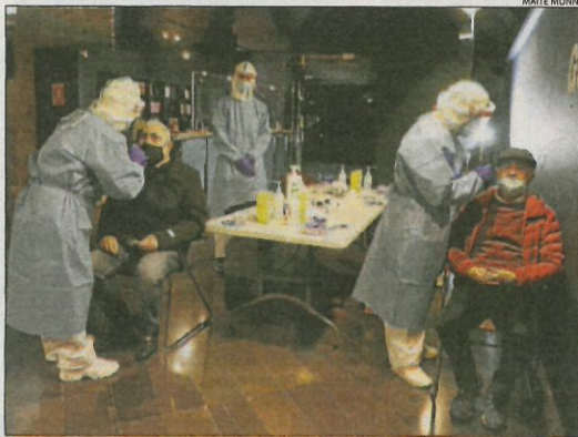
Dos usuaris se sotmeten a un test a l'IEI ahir a la tarda.