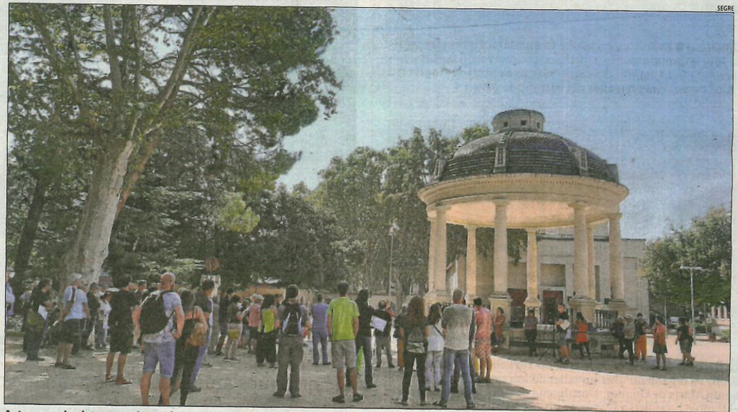
Acte negacionista organitzat el passat 11 de setembre per Josep Pàmies als Camps Elisis de Lleida.