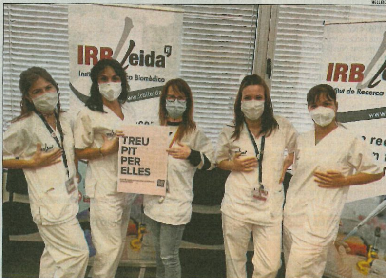
Personal de l'IRB Lleida es van sumar ahir a la campanya #TreUPit pel càncer de mama.

El càncer de mama és la primera causa de mortalitat per càncer en dones, seguit molt de prop pel de colorectal. Segons indiquen les dades de la Societat Espanyola d'Oncologia Mèdica, s'estima que aquest any 2020 hi haurà 32.953 casos nous de càncer de mama a Espanya i es calcula que una de cada vuit dones espanyoles tindrà aquest tumor en algun moment de la seua vida.