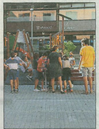
ALEIX FREIXAS / AEN

Les dades que actualitza diàriament Salut assenyalen que l'última setmana van créixer a la regió sanitària de Girona els contagis confirmats amb PCR en gairebé cent (fins a 745), i la taxa de casos confirmats per PCR per cada 100.000 habitants va pujar 11 punts (de 75 a 86). El risc de rebrot (un índex establert pels experts segons l'evolució de l'epi-