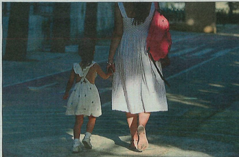
Arribada d'alumnes ahir al col·legi Aljarafe, a Mairena del Aljarafe (Sevilla)

Avis dels col·legis professionals per evitar que se saturi l'atenció primària