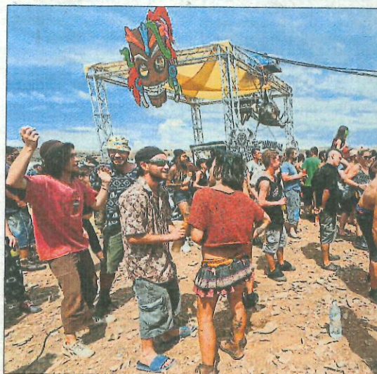
Festa rave al parc nacional de Cévennes (França) el dia 10 passat

A Espanya, el nombre d'hospitalitzats aquest divendres era de