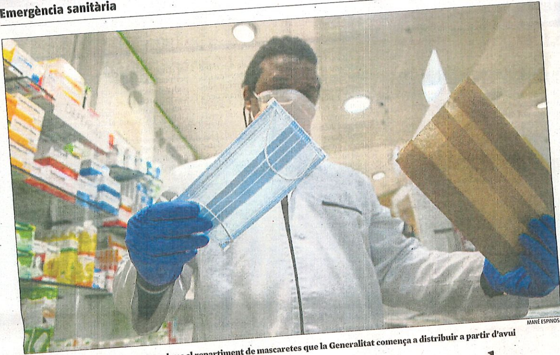
Ahí les farmàcies preparaven en sobres el repartiment de mascaretes que la Generalitat comença a distribuir a partir d'avui