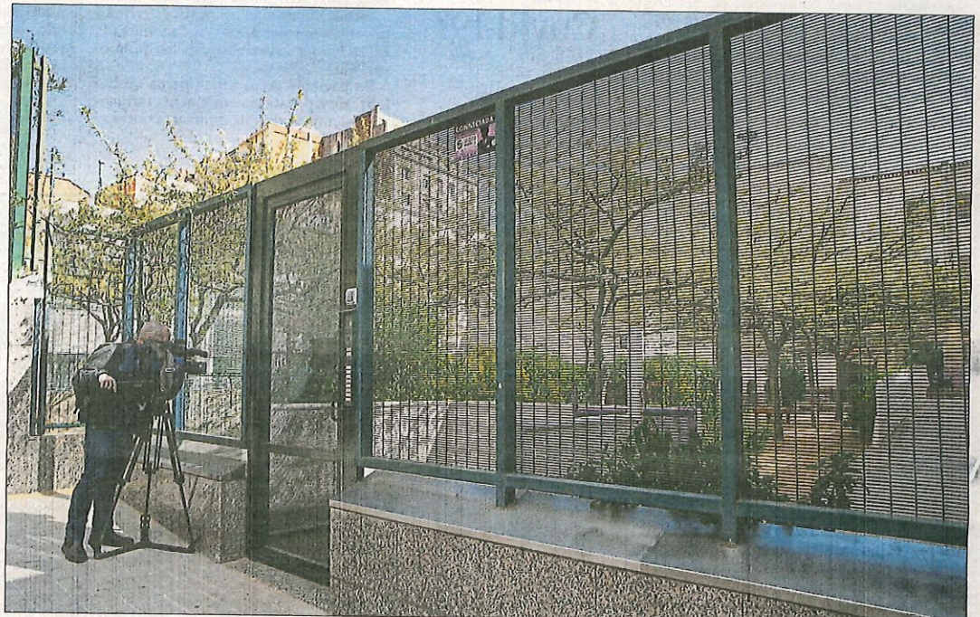
L'escola bressol municipal de Gràcia va ser objecte d'atenció dels mitjans de comunicació ahir, després que es fes públic el contagi

Tanmateix, "les taxes de transmissió són baixes", fins i tot