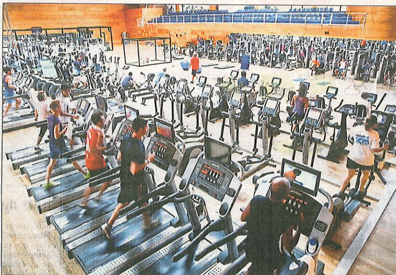
Un gimnàs no té més risc de contagi que una església, però és important netejar les zones de contacte

"Però la higiene de mans sí que és una mesura eficaç, i sembla