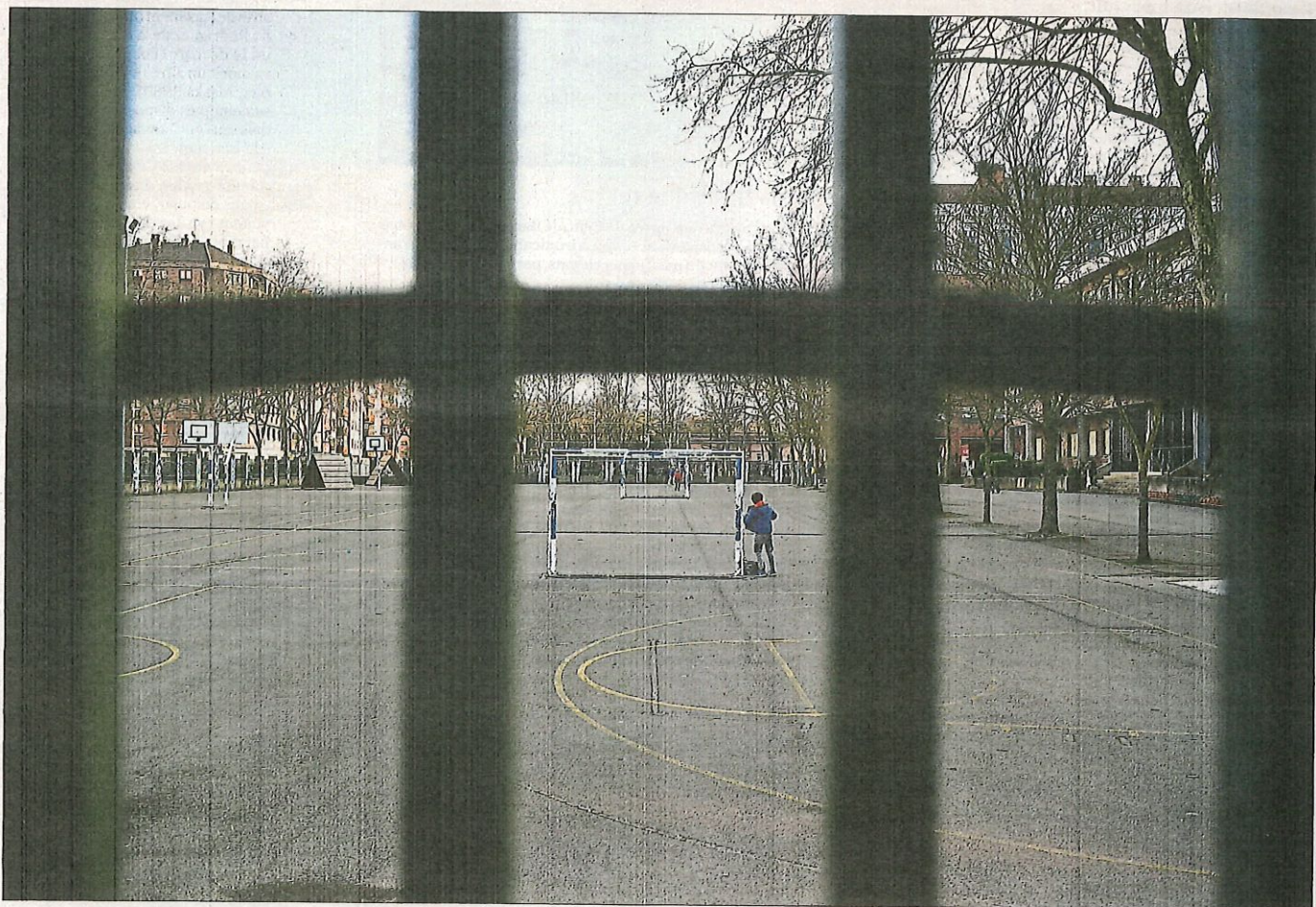
Un nen cordant-se la jaqueta abans de sortir de l'escola a Vitòria, on, com a la Comunitat de Madrid, s'ha decretat el tancament de centres educatius