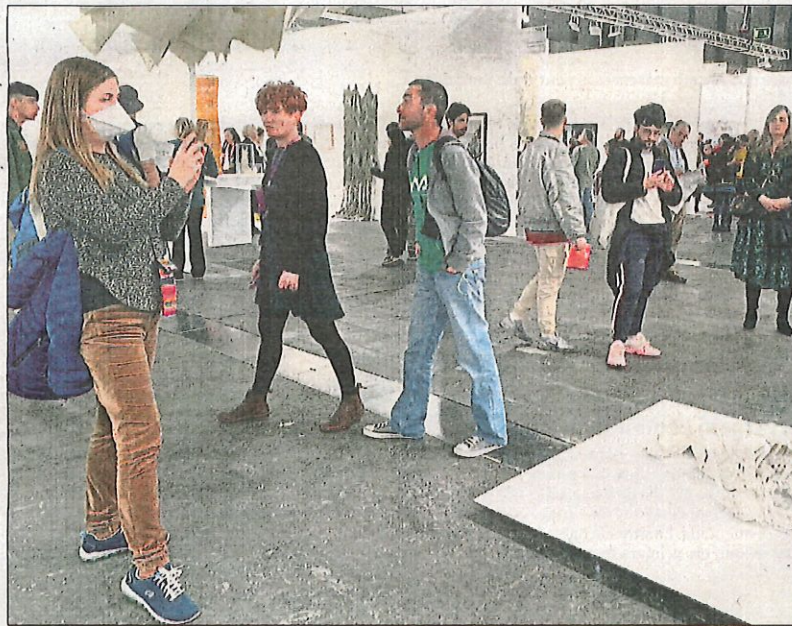
Una visitant amb mascareta fotografiant una obra a la fira Arco de Madrid

Els contagis són 41 i comencen a donar positiu metges que tracten pacients