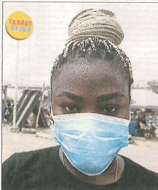
Les màscares han arribat a Nigèria: una dona ahir a Lagos

Ja són més de 83.000 els casos de Covid-19 registrats al món i