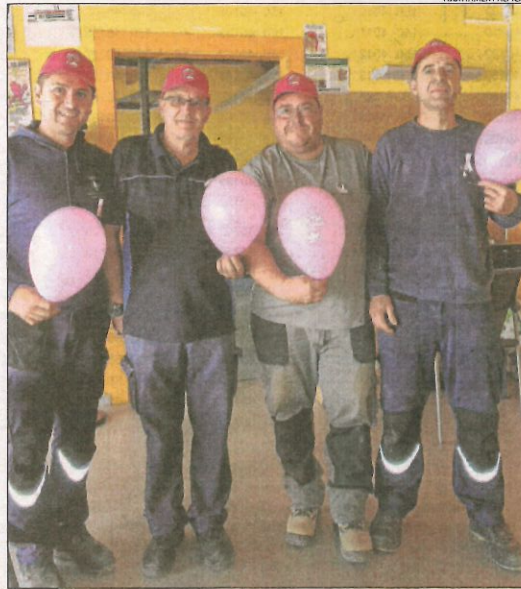
Alpicat, de rosa ■ Serà el color que predominarà els propers dies a la majoria dels municipis lleidatans. A Alpicat, el personal de diferents departaments municipals s'han sumat a l'acció Junts contra el càncer de mama , impulsada per l'AECC.