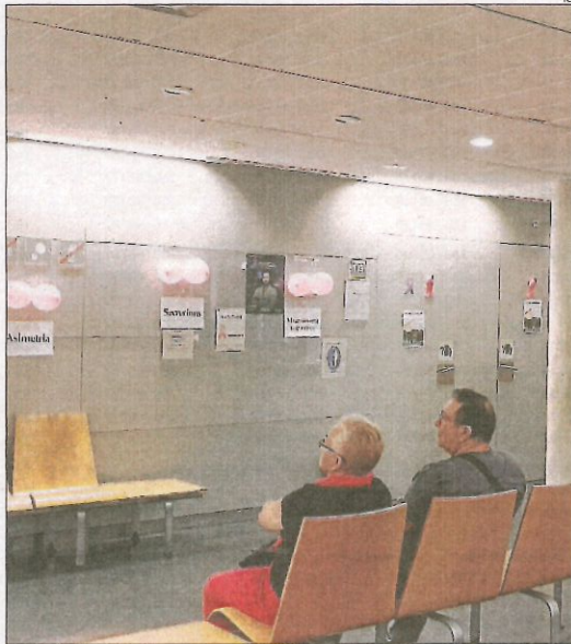
Activitats als CAP ■ Els equips d'Atenció Primària organitzen activitats com caminades, xarrades o tallers amb motiu del Dia Mundial contra el Càncer de Mama que se celebra demà. A la foto, el CAP de rambla Ferran de Lleida decorat de color rosa.

cribratge amb mamografies, la qual cosa redueix la mortalitat en un 30 per cent. Tanmateix, destaca que es hi ha l'inconvenient d'un sobrediagnòstic, ja que es tracten pacients que presenten un càncer no invasor, cosa que es produeix en un 20 per cent dels casos. "Aquests tumors no amenacen la vida de la pacient però reben un tractament invasiu com la cirurgia, la mastectomia, la radioteràpia i l'hormonoteràpia, amb una taxa de curació que superen el 90 per cent de les pacients però que deixa importants efectes secundaris", afirma. L'estudi, que podria donar resultat preliminar d'aquí a menys d'un any, permetrà diferenciar aquelles pacients que sí que necessitin el tractament. Iglesias destaca que no hi ha cap estudi al món que pugui fer aquesta diferenciació a dia d'avui.